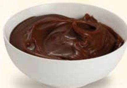
M002123 Farciture Extra al cacao 3 kg al secchiello