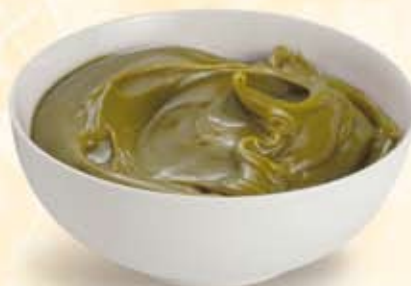
M002121 Farciture Extra al pistacchio 3 kg al secchiello