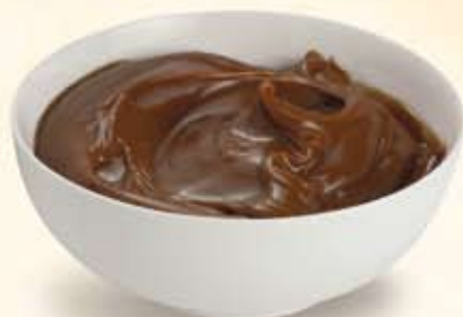
M002122 Farciture Extra alla nocciola 3 kg al secchiello