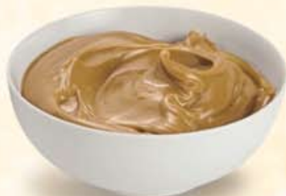
M002124 Farciture Extra alle mandorle 3 kg al secchiello