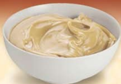
M002120 Farciture Extra ai pinoli 3 kg al secchiello

Ideali per la decorazione e la farcitura di dessert, salse aromatizzate, gelato e mousse. IRRESISTIBILI PER CUPCAKES, MACARONS, GUSCI IN CIOCCOLATO E MIGNONNES.